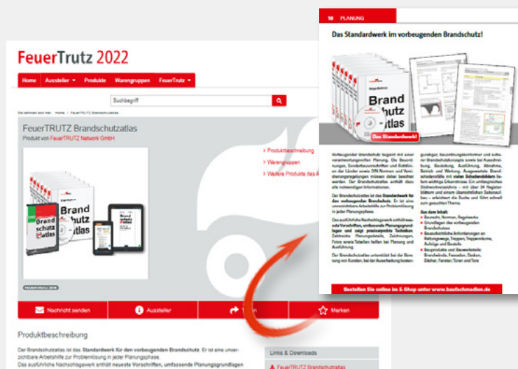
Produktvorstellung mit Text und Bild und PDF-Download