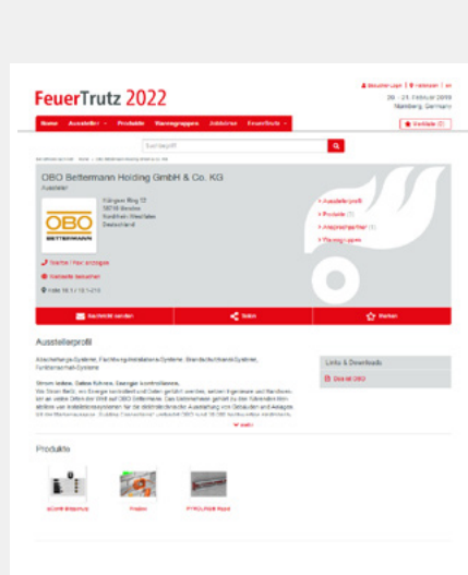
Eintrag mit Logo, Firmenportrait und Produkten